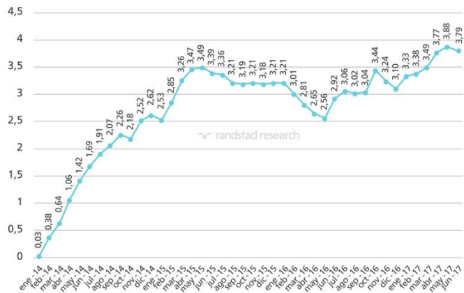
Variación intermensual de la afiliación a la Seguridad Social en España