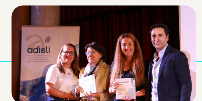
Reconocimiento de la Asociación ADISLI