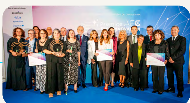
AEC Tech Innovation Awards 2025 – Impacto Social