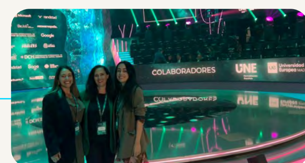
Digital Skills Awards Spain 2025 – Diversidad e Inclusión Social